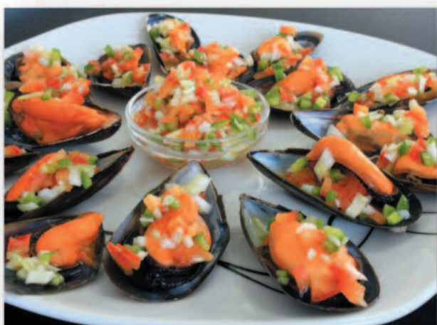
Del 20 al 22 Mejillones a la vinagreta de frutos