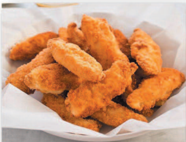
Del 6 al 8 Delicias de pollo con mostaza y miel