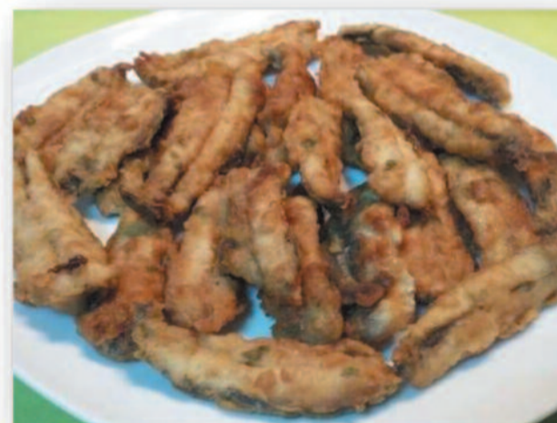
Del 27 al 29 Boquerones al adobillo