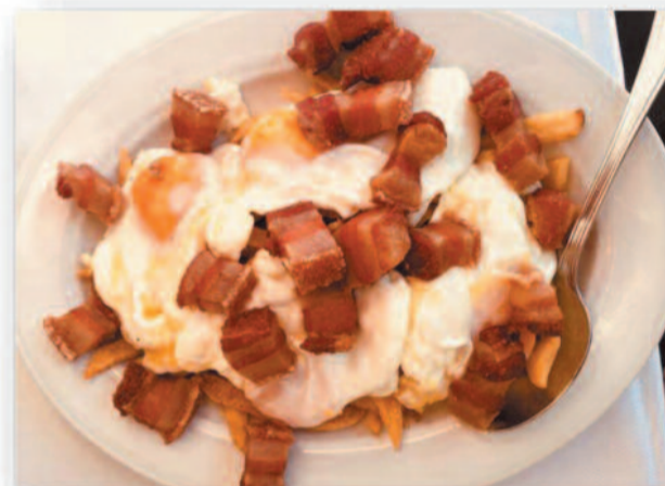
Del 13 al 15 Huevos rotos Don José con torreznos y salsa mojo-picón